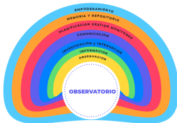
Figura 2. Dimensiones de los Observatorios

versos por diferentes actores e instituciones, públicas, privadas o de la sociedad civil. Además, también es ampliamente reconocida la necesidad de un vínculo con territorios y poblaciones como inmanente al concepto de observatorio.